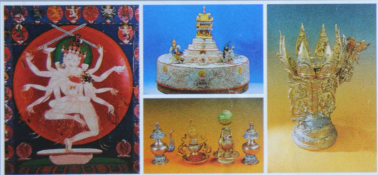
འཇམ་དཔལ་ལྷན་པོ་གསལ་བྱེད་པའི་ལྷོ་ལྷོ་གྲོ་ལོ་ བུ་བླ་ལྷན་པོ་གསལ་བྱེད་པའི་ལྷོ་ལྷོ་གྲོ་ལོ་ Potala Palace visiting souvenir