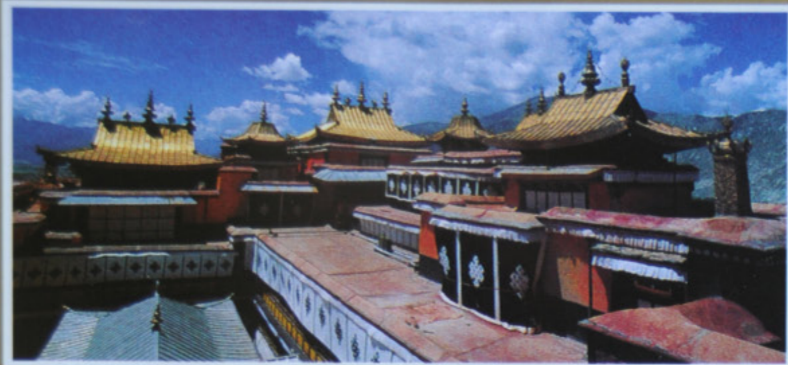
འཇམ་དཔལ་ལྷན་པོ་གསལ་བྱེད་པའི་ལྷོ་ལྷོ་གྲོ་ལོ་ བུ་བླ་ལྷན་པོ་གསལ་བྱེད་པའི་ལྷོ་ལྷོ་གྲོ་ལོ་ Potala Palace visiting souvenir